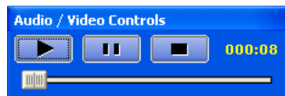
Hang és videó lejátszás vezérlő

Videó lejátszás pillanatképe 1280x1024 felbontású képernyőn. (1024 x 768 felbontású képernyőn történt a képernyőműveletek rögzítése).